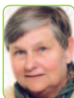
Sykepleier og bypatriot

Venstre for meg er det partiet som gir det enkelte menneske stor frihet under ansvar over for samfunnet, og ikke minst hensynet til våre medmennesker. Venstre for meg er partiet med rotfestede moral og sosial verdier, uten å virke hindrende på personer, bedrifter eller sammenslutninger. Venstre for meg har en profil hvor helsetjenester til alle skal prioriteres, hvor sosialtjenester skal vær oppbyggende og ikke bare støttende. Venstre for meg er partiet som tar hensyn til miljøet, naturen, og vil bekjempe forurensing med fornuftige midler. Venstre for meg er partiet som viser omsorg og støtte for mennesker i andre deler av verden som lider.