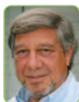
Overlege dr.med. Leder for Fertilitetsklinikken Sykehuset Telemark