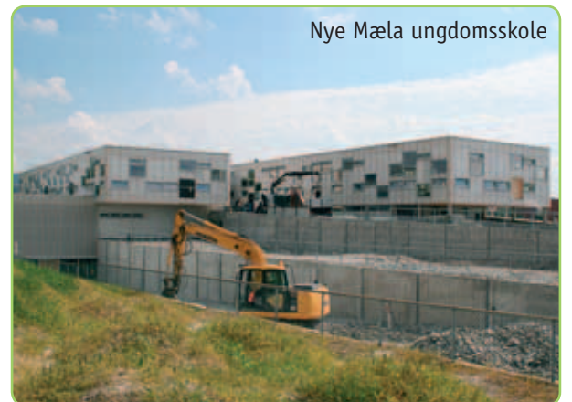
Nye Mæla ungdomsskole