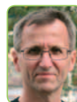
Tingrettsdommer og leder Skien Venstre

Jeg valgte Venstre fordi Venstres idegrunnlag hvor man stoler på det enkelte menneskets evne og vilje til å engasjere seg og være en aktiv samfunnsdeltaker er viktig. Vi trenger et kreativt og nyskapende Skien hvor det er attraktivt både å bo og virke. Venstre fokuserer dessuten på eldreomsorg, helsetjenester, kultur, miljø og økt næringsutvikling.