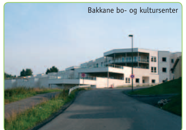
Bakkane bo- og kultursenter