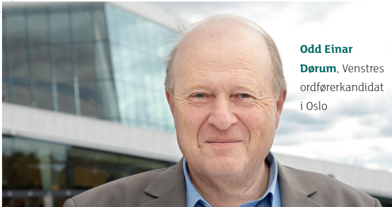
Odd Einar Dørum , Venstres ordfører kandidat i Oslo