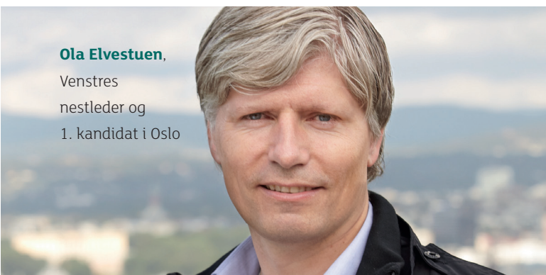
Ola Elvestuen , Venstres nestleder og 1. kandidat i Oslo