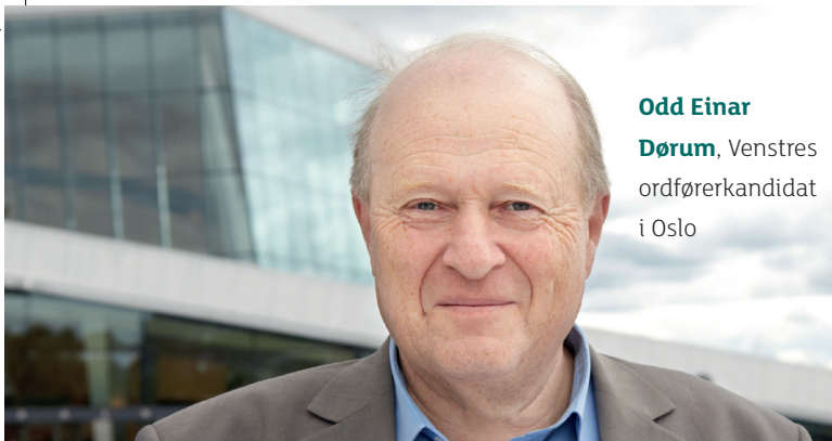
Odd Einar Dørum , Venstres ordfører kandidat i Oslo