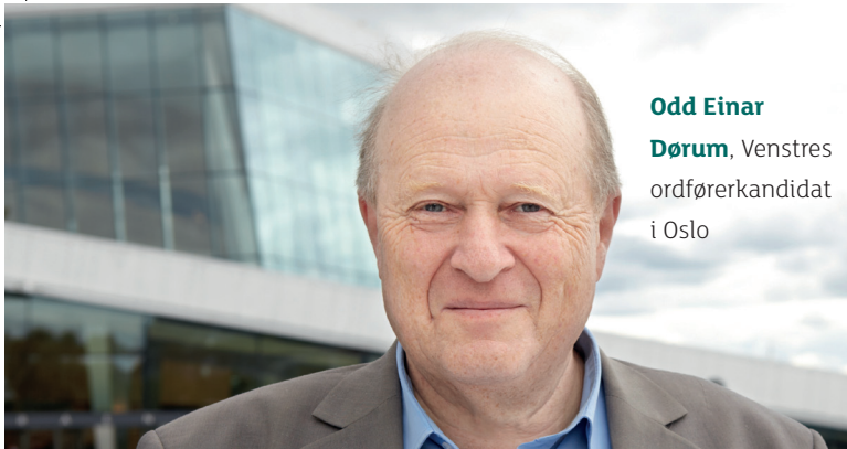
Odd Einar Dørum , Venstres ordfører kandidat i Oslo