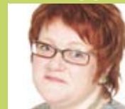
Trine Skei Grande Nestleder i Venstre

Vi engasjerer oss både i enkeltsakene og de store internasjonale spørsmålene. Og de siste årene har vi utviklet et nært forhold til våre europeiske søsterorganisasjoner. Landsstyret valgte å anbefale at landsmøtet skal vedta at Norge skal beholde dagens tilknytningsform til EU. Men det er klart at EØS-samarbeidet hele tiden må vurderes og videreutvikles. Til tross for at Venstre hele tiden fører en diskusjon med argumenter for og mot norsk medlemskap i EU må vi konstatere at spørsmålet om Norge skal sende en ny EU-søknad ikke er en stor del i norsk politisk debatt. Denne erkjennelsen be-