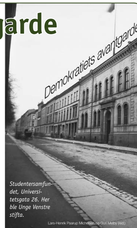
Studentersamfundet, Universitetsgata 26. Her ble Unge Venstre stifta.

eller direkte til Unge Venstre, Møllergaten 16, 0179 Oslo, e-post: unge@venstre.no Bøkene er tilgjengelige fra 100-årsdagen 27. januar 2009.