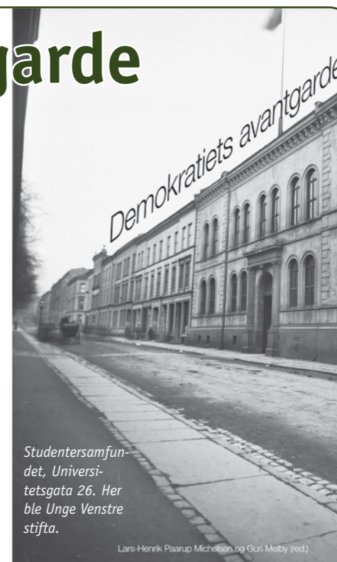
Studentersamfunnet, Universitetsgata 26. Her ble Unge Venstre stifta.

eller direkte til Unge Venstre, Møllergaten 16, 0179 Oslo, e-post: unge@venstre.no Bøkene er tilgjengelige fra 100-årsdagen 27. januar 2009.