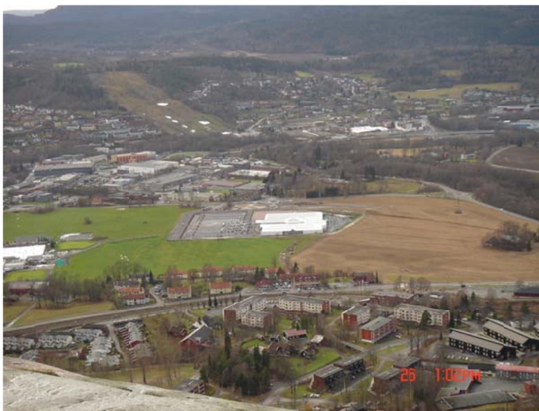
Plantasjen med tilhørende parkeringsplass på Løken gård (Flertallet vedtok å bygge ned jordet ved høyspentmast til høyre i bildet i denne perioden)

Noen kjenner prisen på alt, men ikke verdien av noe! Oscar Wilde